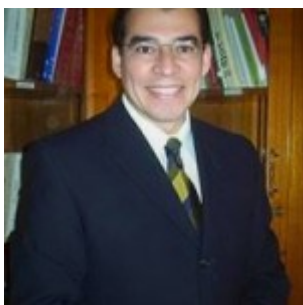
Not. Márquez González

En las reuniones que tuvieron lugar en Berna, Suiza, el 1 de mayo de 2014, en el marco de la